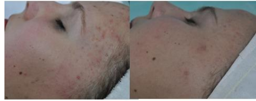
Início do acompanhamento

CIA - CENTRO INTERNACIONAL DE APRIMORAMENTO BUONA VITA