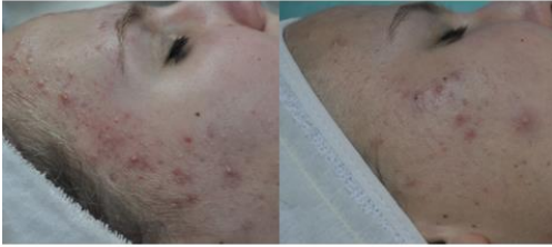
Início do acompanhamento